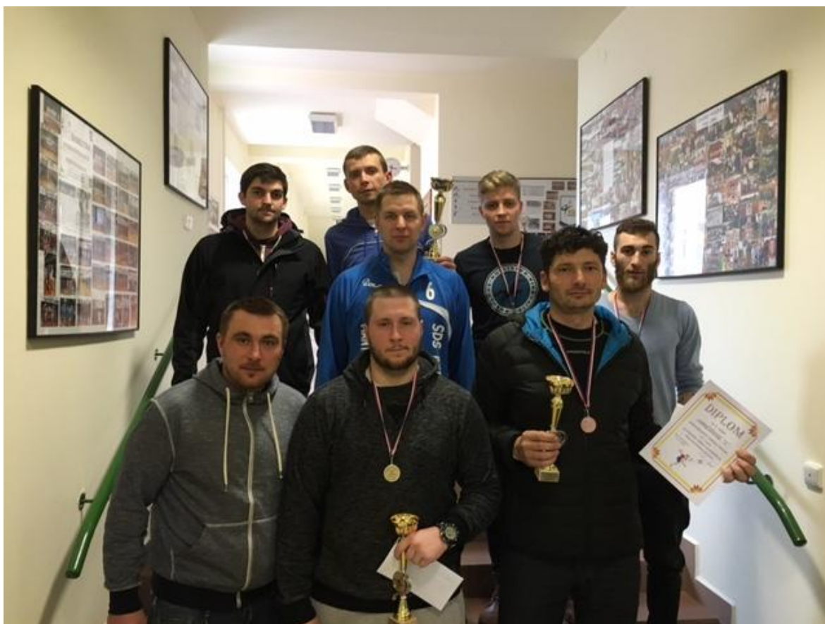
Společné foto nejlepších družstev Memoriálu.